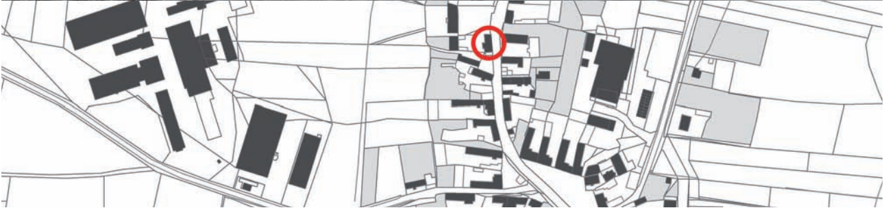
Velký Bor (Čechy, Klatovy) † Jihočeský dům s doškovou valbovou střechou. Dům čp. 26 přestavěn na počátku šedesátých let 20. století.

foto V. Mencl, nedat., LA/438 s. 171; Archiv NM, fond Dobroslava a Václav Menclovi 3122_283