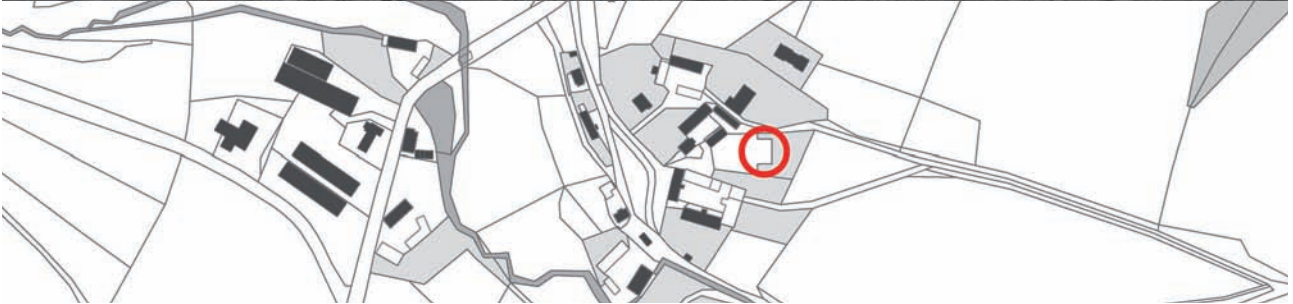
Ješetice (Čechy, Benešov) † Stodola s polygonálně uzavřenými perami. Stodola patřila k usedlosti čp. 3; zanikla na počátku osmdesátých let 20. století.

07 | 1 2 3 4 5 6 7 8 9 10 11 12 13 14 15 16 17 18 19 20 21 22 23 24 25 26 27 28 29 30 31