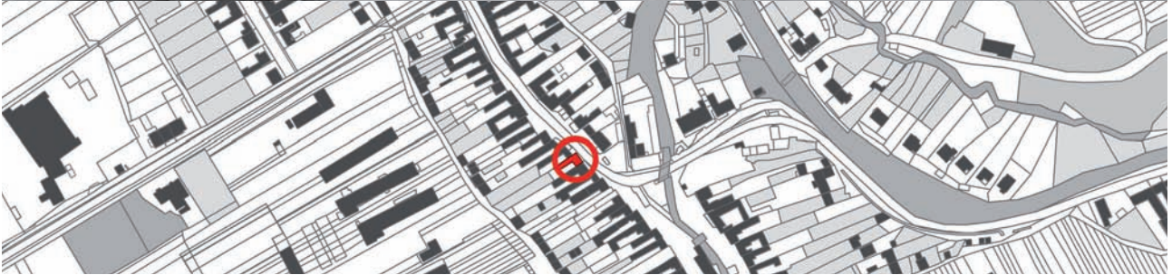
Javorník (Morava, Hodonín) † Průčelí zděného domu č. 73 s návratím a sýpkou v patře nad světnicí a síní. foto V. Mencl, nedat., LA/117 s. 50; Archiv NM, fond Dobroslava a Václav Menclovi 3122_083

01 | 1 2 3 4 5 6 7 8 9 10 11 12 13 14 15 16 17 18 19 20 21 22 23 24 25 26 27 28 29 30 31