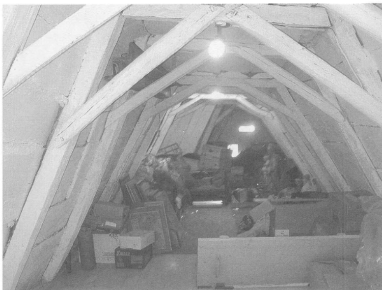
Obr. 7. Lysovice (okr. Vyškov), dům čp. 33; průhled lepenecovou komorou z prostoru nad horní síní směrem k žudru. Foto Z. Syrová. – Abb. 7. Lysovice (Bez. Vyškov), KNr. 33; Durchblick durch die Lehmputzkammer vom Raum über der oberen Halle in Richtung Vorbau; Foto Z. Syrová.

Na drobných domech na Vyškovsku je podobně jako u výše uvedených domů bez žudru na Slovácku dokumentovaných J. Vajdišem a O. Máčem, dobře patrný základní dispoziční problém,