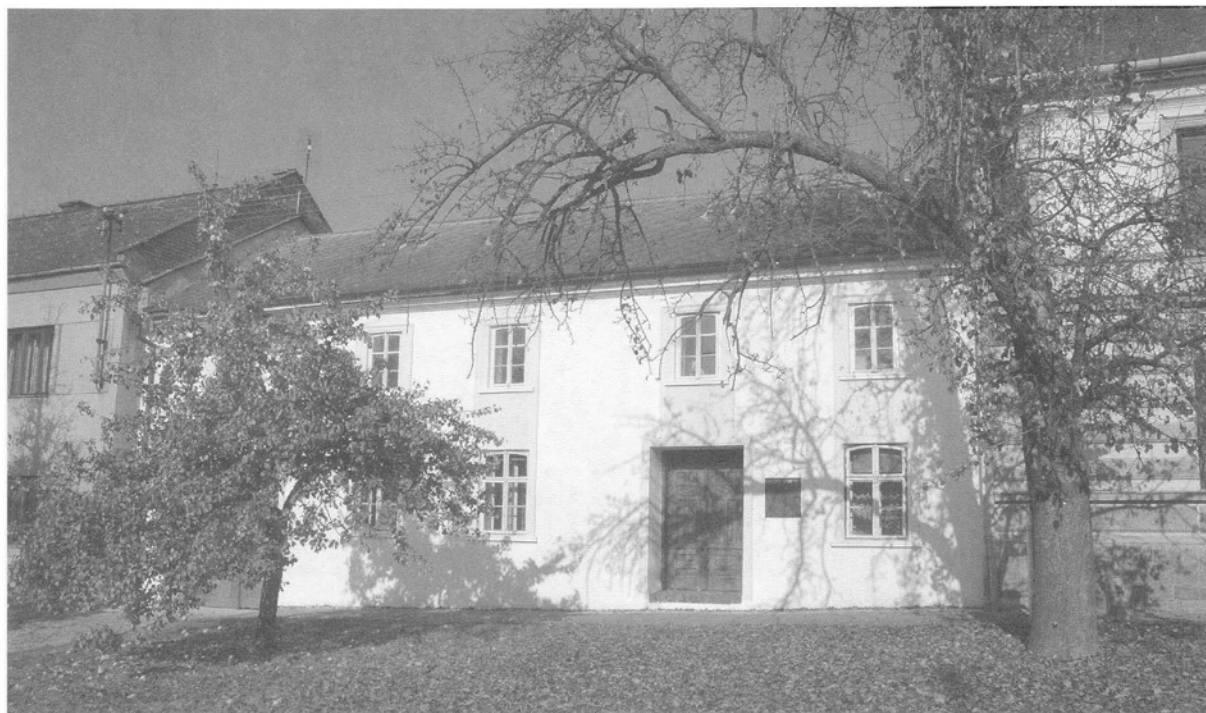
Obr. 9. Vojnice (okr. Olomouc), dům čp. 11; dům usedlosti s rohovou síní a plně vyvinutým sýpkovým patrem nad uličním křídlem. Foto Z. Syrová.– Abb. 9. Vojnice (Bez. Olomouc), KNr. 11; Gutshaus mit Eckhalle und voll ausgebildetem Schüttbodengeschoss über dem Straßentrakt; Foto Z. Syrová.

jehož si povšiml už Josef Kšír. Má-li být síň průchozí do dvora, je potřeba si vypomoci jejím protažením nebo rozšířením; černá kuchyně, vložená do prostoru síně na straně k obytné místnosti, pak v prostoru síně vytváří nepohodlnou překážku, kterou je nutno obcházet.