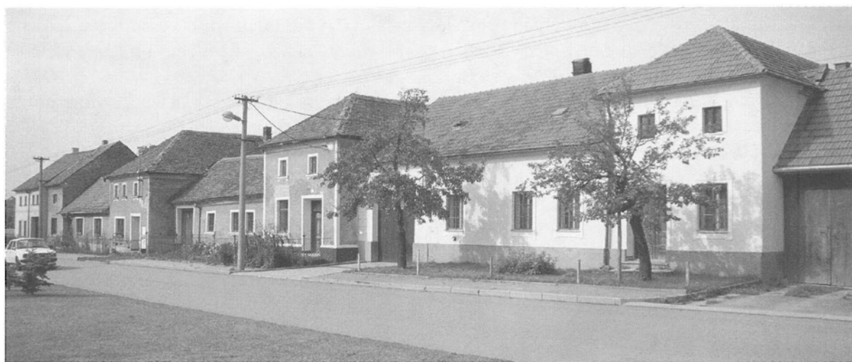
Obr. 8. Kučerov (okr. Vyškov), domy čp. 44, 43, 42, 41; řada usedlostí s domy s rohovou síní s vyvinutou horní komorou nad síní a zadní komorou. Foto Z. Syrová. – Abb. 8. Kučerov (Bez. Vyškov), KNr. 44, 43, 42, 41; eine Reihe von Anwesen mit Häusern mit Eckhalle und ausgebildeter oberer Kammer über der Halle und mit hinterer Kammer; Foto Z. Syrová.